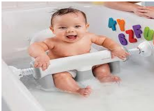
صندلی مخصوص کودک در وان حمام