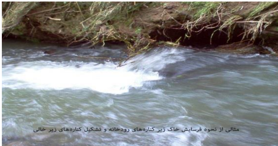
فرسایش خاک و خالی شدن زیر کناره های رودخانه

جریان مداوم آب موجب فرسایش دائمی لبه ها و کناره های رودخانه می شود. این موضوع باعث می شود که آرام آرام زیر لبه های رودخانه خالی شود. در نتیجه هر چند کناره رودخانه برای افرادی که روی آن ایستاده یا راه می روند، پایدار به نظر می رسد، ولی در حقیقت این لبه ها هر لحظه آماده فرو ریختن است. از طرف دیگر، اگر شناگر بخواهد برای خارج شدن از آب رود از این لبه ها به سمت بالا حرکت کند، احتمال فرو ریختن آنها وجود دارد. چنین فردی، به سختی می تواند خود را نجات دهد. امکان فرو ریختن این لبه ها حتی در هنگام ماهیگیری هم وجود دارد. لذا گذاشتن گارد ریل، سنگ چین و سایر روش های محافظتی دیگر در رودخانه هایی که مردم جهت ماهیگیری تفریحی می روند نیز بسیار مفید است . گرچه به کار بردن این روش ها می تواند پرهزینه باشد ولی با در نظر گرفتن هزینه های ناشی از غرق شدگی، بسیار ناچیز است.