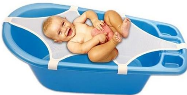
وان حمام کودک